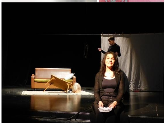
Théâtre des Franciscains, Béziers.